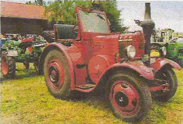
Einer der schönsten Schlepper war dieser rote Lanz

Bulldog D7531 mit einem Hubraum von 4767 ccm und einer Leistung von 25 PS. Es handelt sich hier um einen ehemaligen Holzgas Bulldog der zurück gebaut wurde, nur der hohe Kühler erinnert noch an seine Vergangenheit.