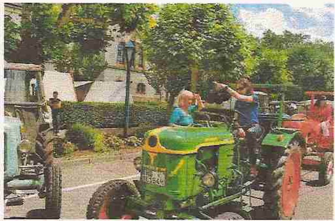
Beim Traktor-Korso durch Hockenheim.