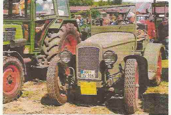
Ein sehr gut restaurierter Hanomag RL 20 von 1939 ein gesuchtes Sammlerstück.

Die Bewirtung war in der großen Maschinenhalle des Hofguts untergebracht. Eine kleinen Halle war für die Kinder zum spielen eingerichtet. Im Freigelände lagen Strohballen auf denen die Kinder toben konnten. Das Ausstellungsgelände war fast bis auf den letzten Stellplatz mit Schleppern belegt