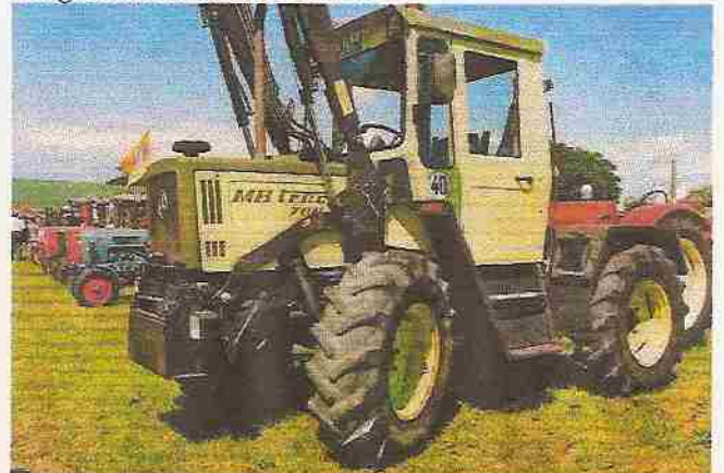
Auch die Schlepper mit dem Stern sind längst Kult. Hier ein sehr schön restaurierter MB trac 700.