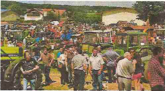
Eine Teilansicht des Ausstellungsgelände

Bei bestem Traktortreffen-Wetter veranstaltete das „Schlepper Team Bockschaft“ am 27. Mai ihr jährliches Schleppertreffen. Eine schöne gemütliche Veranstaltung die wie immer gut besucht war. Auch der OSCK war hier gut vertreten, bei keinem anderen Schleppertreffen außer unseren eigenen Veranstaltungen kann man so viele OSCK'ler antreffen wie hier.