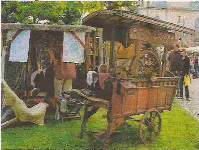
Ein sehr schöner Scherenschleiferkarren