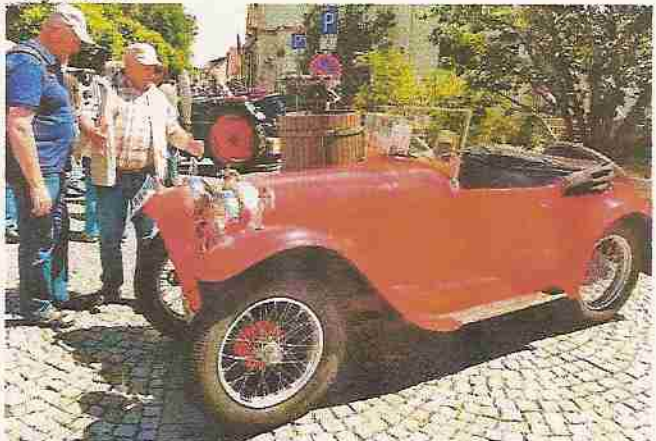
Bei der Fahrzeugschau ein interessanter Sportwagen aus Tschechien, der AERO Typ 662 R18, Baujahr 1934, mit einem 2 Zylinder Zweitakt-Motor der 18 PS leistet.