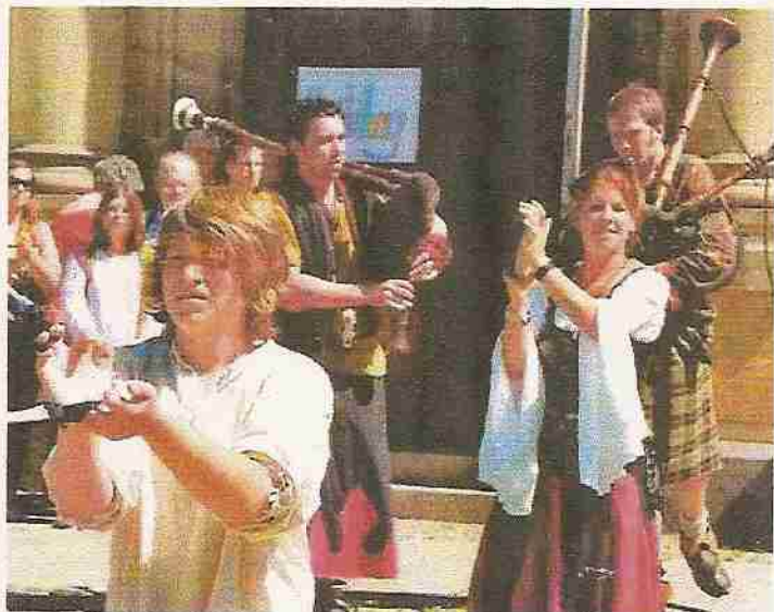
Eine Musikgruppe die mit dem Dudelsack aufspielt.