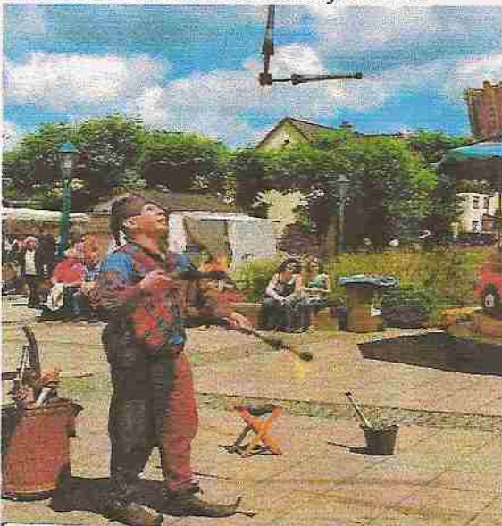
Ein Gaukler jongliert mit fünf Fackeln.