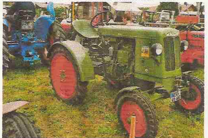
Der Schlüter AS 150 mit einer Leistung von 15 PS aus der Zeit als Schlüter noch formschöne Traktoren baute.

Eine Besonderheit der frühen Schlüter-Motoren war die schwenkbare Wirbelkammer die beim Kaltstart um 180 Grad geschwenkt wurde. Der Kraftstoff gelangte