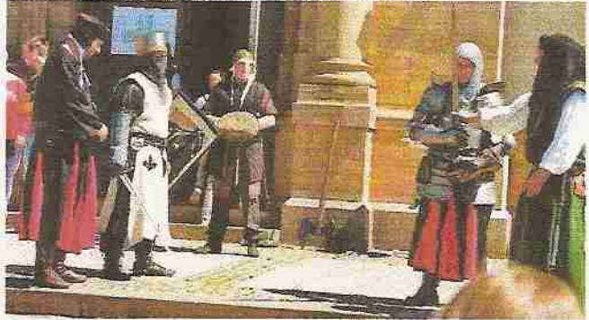
Die Vorstellung der Ritter die hier Schaukämpfe vorführten.